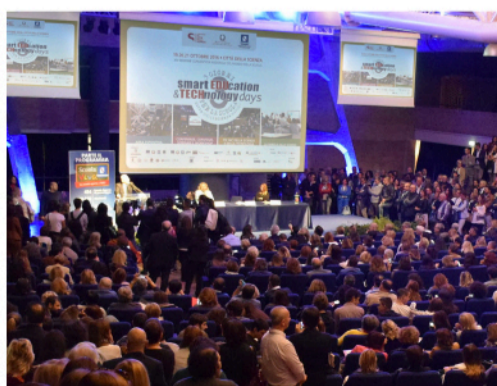
CONFERENZE, CONVEGNI, SEMINARI E WORKSHOP