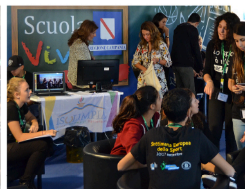
LA PAROLA ALLE SCUOLE