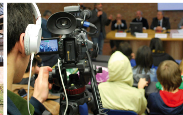
LA PAROLA ALLE SCUOLE