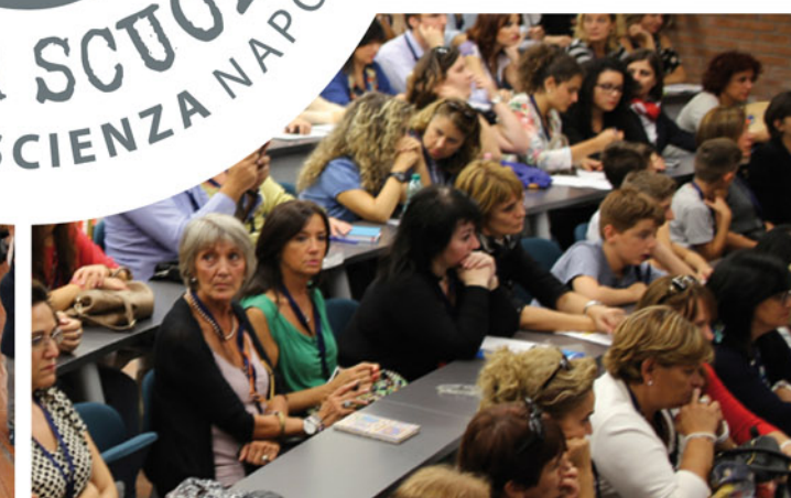
CONFERENZE, CONVEGNI, SEMINARI E WORKSHOP