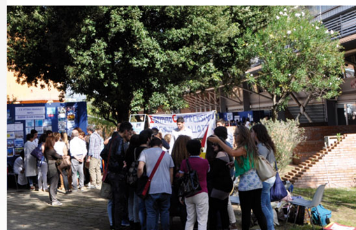
PIC NIC DELLA SCIENZA E DELLA TECNOLOGIA