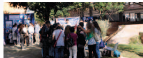
PIC NIC DELLA SCIENZA E DELLA TECNOLOGIA