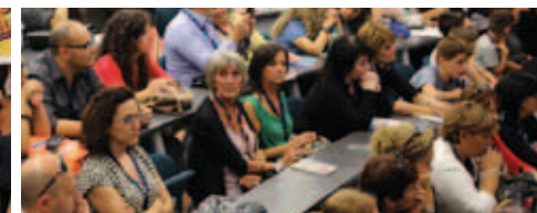
CONFERENZE, CONVEGNI, SEMINARI E WORKSHOP