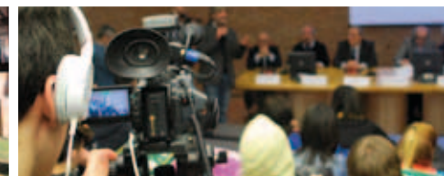
LA PAROLA ALLE SCUOLE